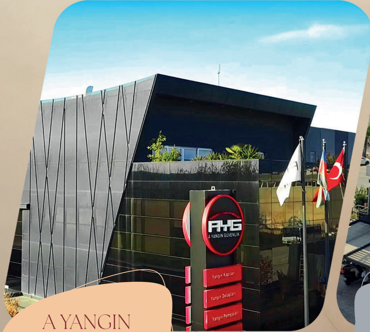
A YANGIN GÜVENLİK