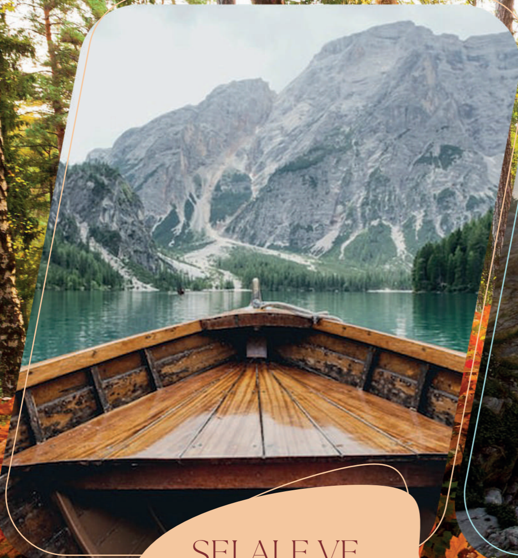
ŞELELE VE GÖLETLER