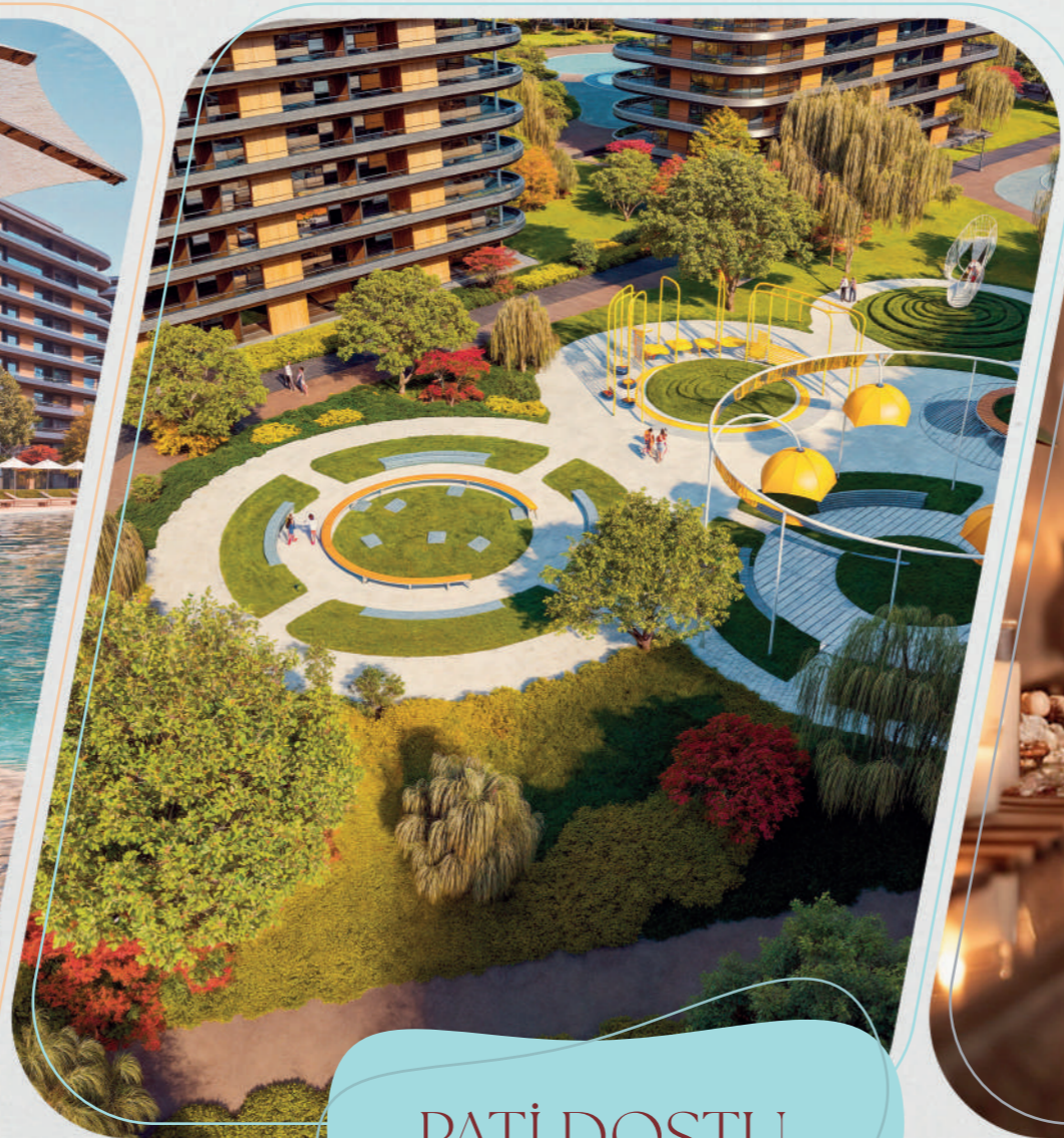
PATİ DOSTU ALANLAR